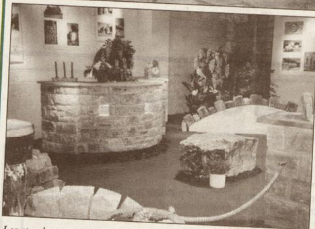
Les stands merveilleux ...

La seconde édition du salon «Bâtir - Bauen» à Malmédy a ouvert ses portes ce dernier vendredi 5/2 au soir, en présence de plusieurs centaines d'invités ou exposants.